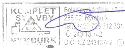
..... za zhotovitele Jaromír Černý - jednatel