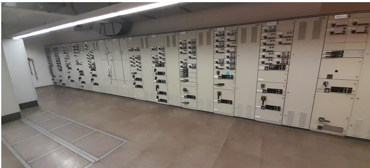
Obr. Prostory v rozvodně NN90