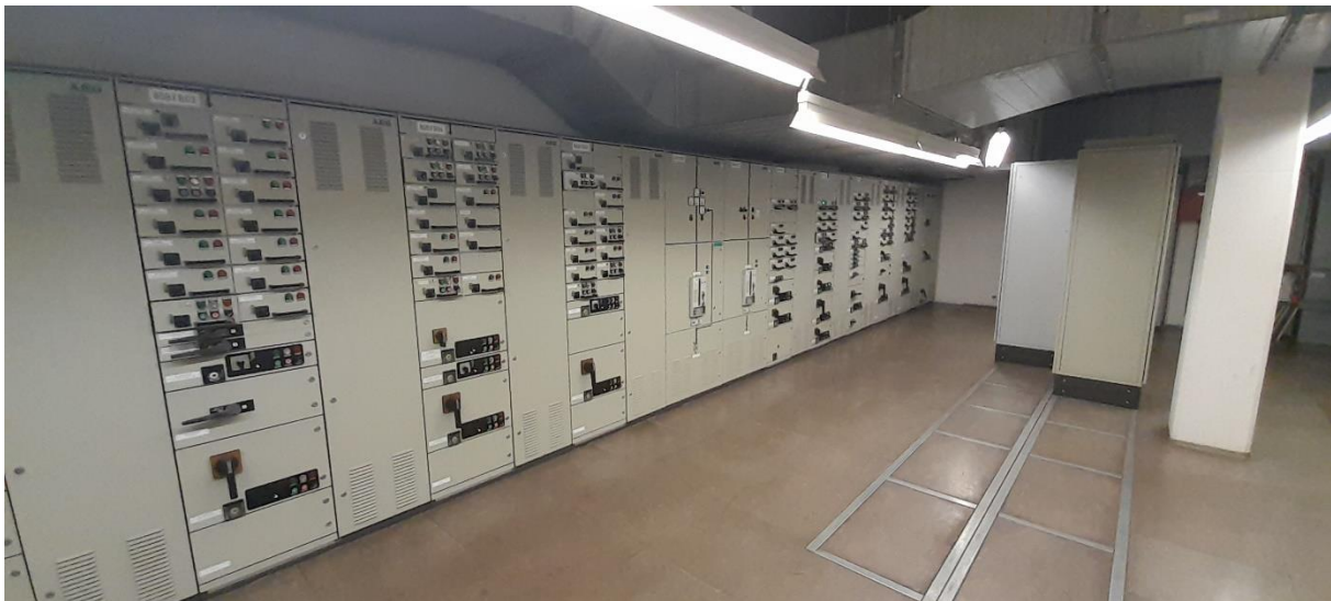
Obr. Prostory v rozvodně NN80