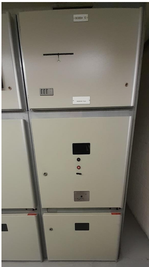
Obr. Skříň rozvaděče 90BBA (v totožném provedení i dispozici je 80BBA)