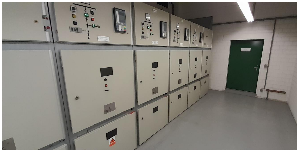
Obr. Rozvodna VN90 (poslední skříň je 90BBA)