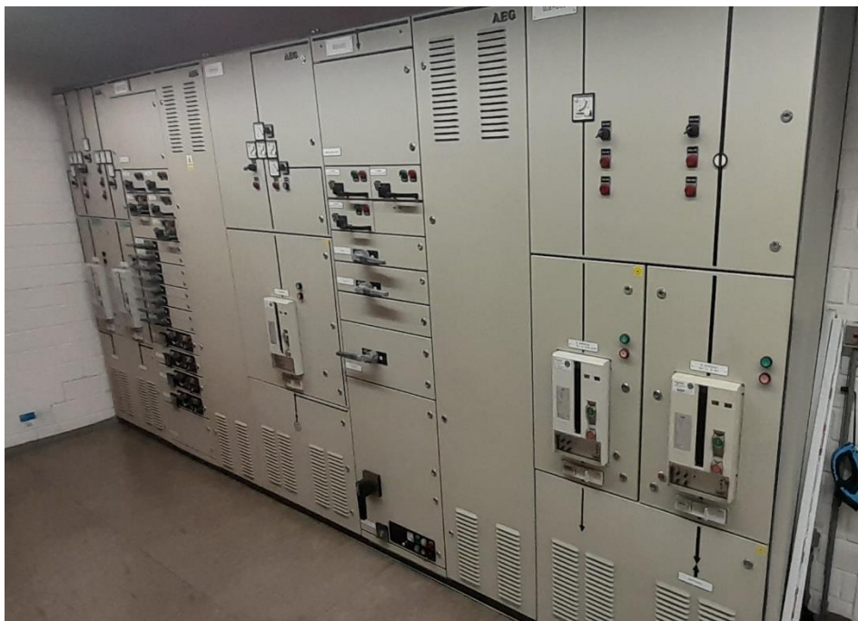
Obr. Rozvaděče 00BHD