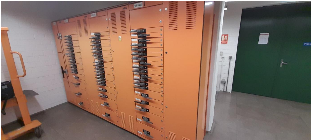
Obr. Rozvaděče 90BUA