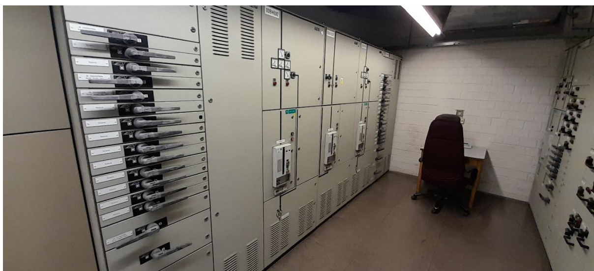
Obr. Rozvaděče 00BHF, 00BHE